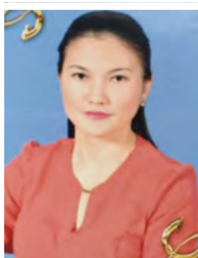
G.T. Yeskazina Aktobe Medical College

«Trilingualism» is nowadays requirement. The language has a sacred and great position in every nation and country. Nowadays labour market requires from us bringing up of competitive, smart, educated citizens. To entry Kazakhstan to the top 30 developed countries.